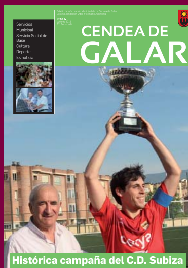
Histórica campaña del C.D. Subiza

El precio es de 0,60 euros un viaje y de 5 euros un bono de 10 viajes.