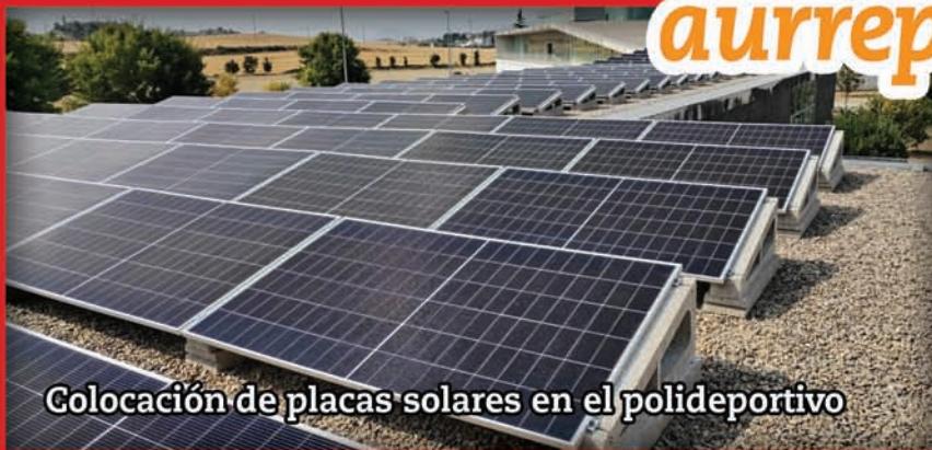
Colocación de placas solares en el polideportivo