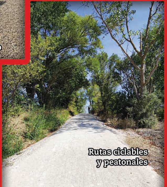
Rutas ciclables y peatonales