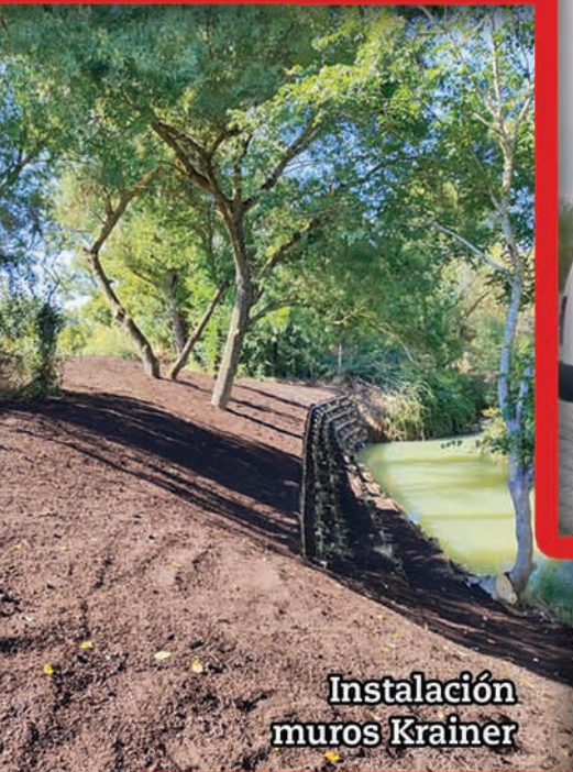
Instalación muros Krainer