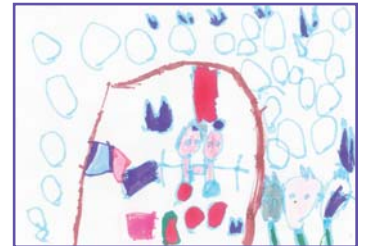
Aurora Crespo López (4 años), Esparza