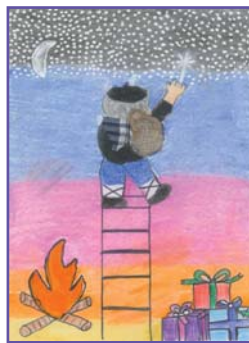
Asier Iturralde (8 años), Salinas