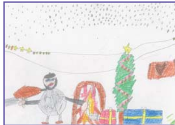
Izei Uriz Equisoain (7 años), Cordovilla