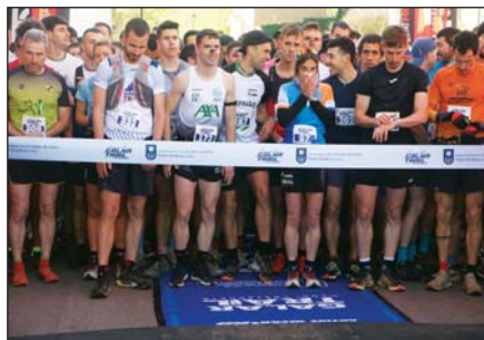
Cogiendo posiciones para la salida.