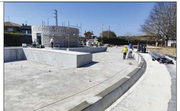
Nuevo edificio de depuración.

Desde el ayuntamiento se agradece la paciencia de los vecinos y vecinas, recordando que con la finalización de las obras se podrá disfrutar este verano de un espacio renovado, más seguro, eficiente y adaptado a las necesidades actuales.