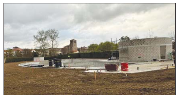
Zona de esparcimiento con el césped ya sembrado.