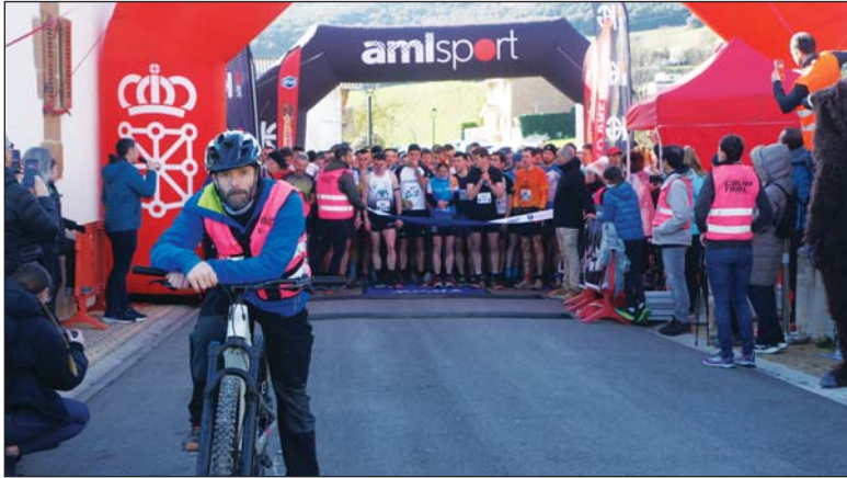
Preparados para salir.