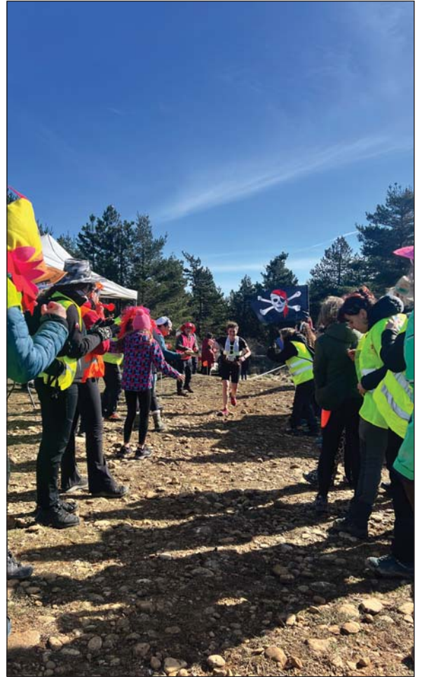
Los puntos calientes con los voluntarios y voluntarios dieron color y calor al paso de los participantes.