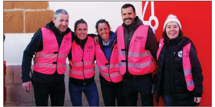
Equipo de organización en la salida y llegada.