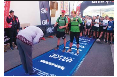
Homenaje a los escobas de la prueba antes de la salida.