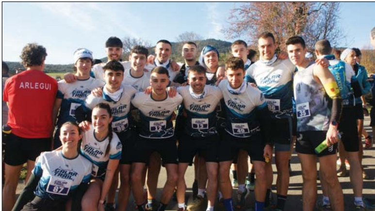
Grupo de participantes de la Cendea poco antes de la salida.