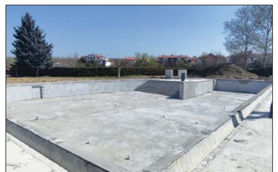
Recrecido de mortero en el vaso de piscina.